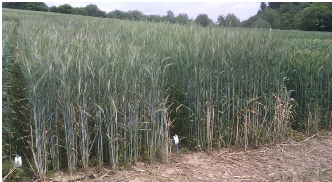
Der hohe Krankheitsdruck im heurigen Frühjahr machte auch dem Triticale zu schaffen. Nur die wenig anfällige Sorten brachten wirklich gute Erträge. Im Bild Elpaso (li) und Tricanto (re).