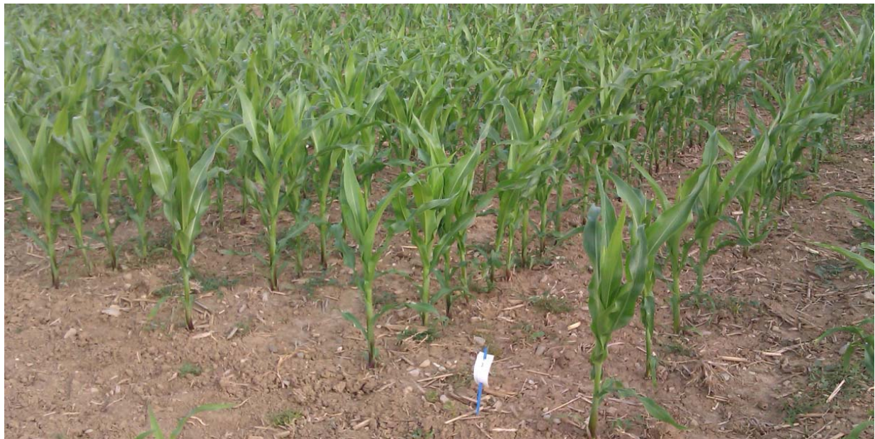
Der Erosionsversuch im Juni 2014: Der Mais - im Bild Variante 3 ( Mulchsaat) - zeigte eine gute Jugendentwicklung Die Saat lief dank guter Technik auch in den Direktsaatvarianten gut und gleichmäßig auf.