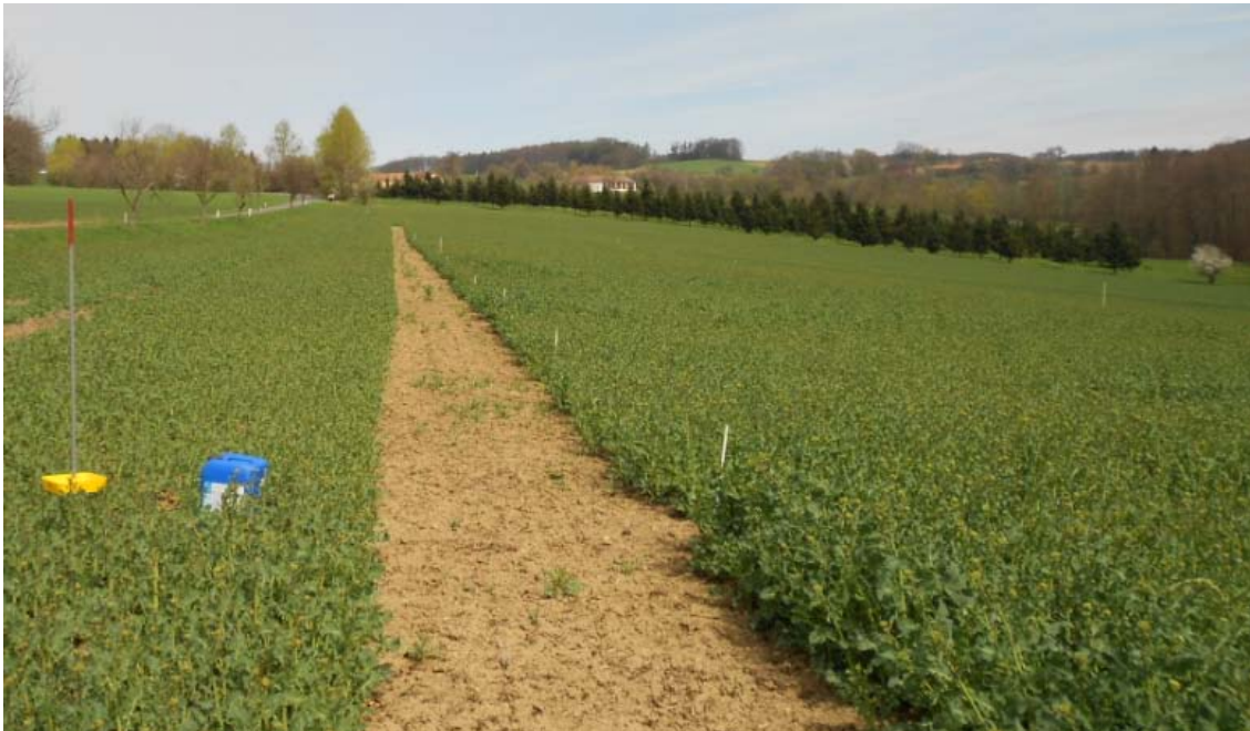
Der Erosionsversuch der LFS Pyhra am 10.04.2012 ; Die Hangneigung dieses Feldstückes (Hintere Weingartleite) von durchschnittlich 12 % ist auf diesem Bild nicht sofort erkennbar.